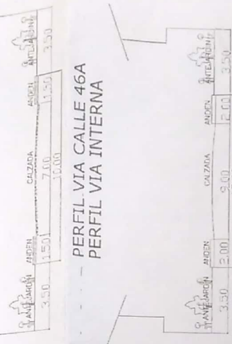
PERFIL VIA CALLE 46A PERFIL VIA INTERNA